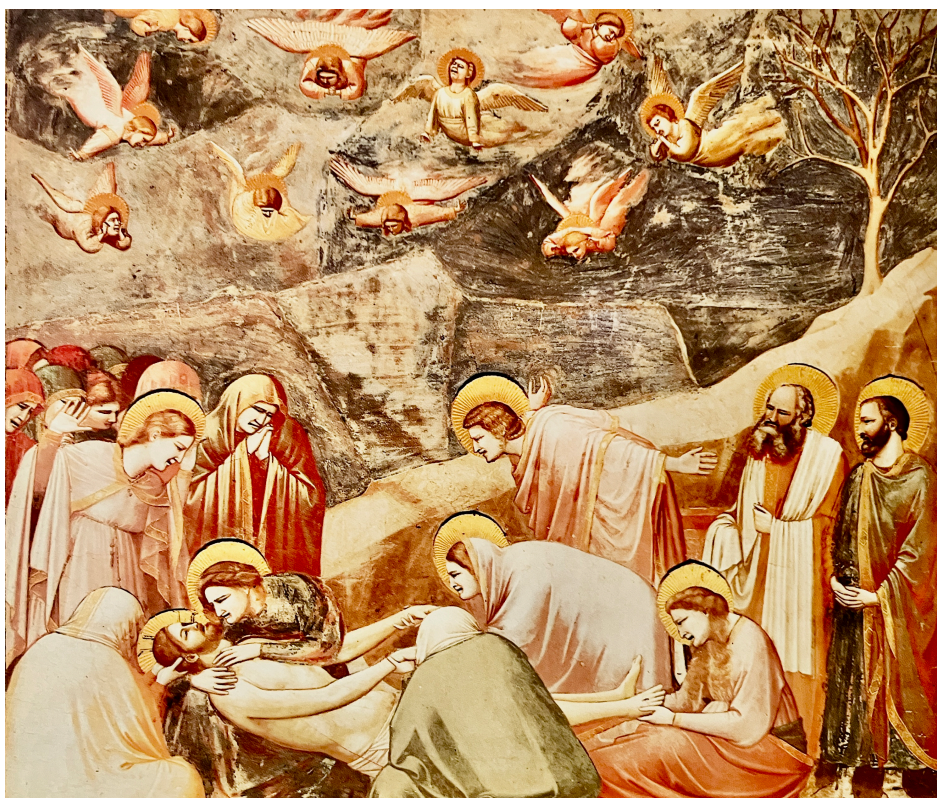
Giotto, (vers 1266-1337), Chapelle des Scrovegni. La Déposition du Christ.

20-24 avril : pèlerinage diocésain à Lourdes.